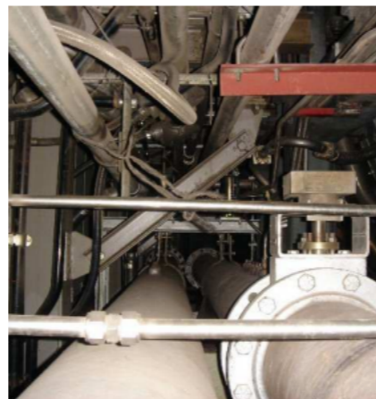
Wirwar van buizen